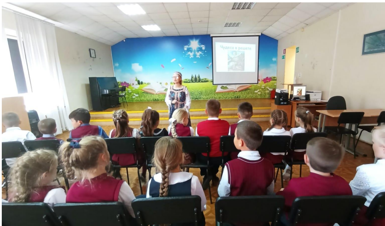
Фольклорная игра «Чудеса в решете» в Библиотеке №31