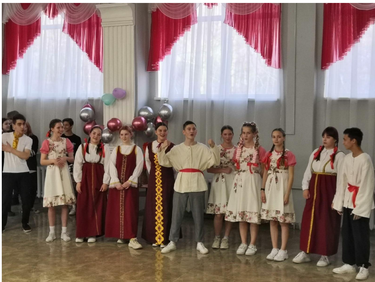
Осенины-2022 (команда Школьного совета старшекласников)