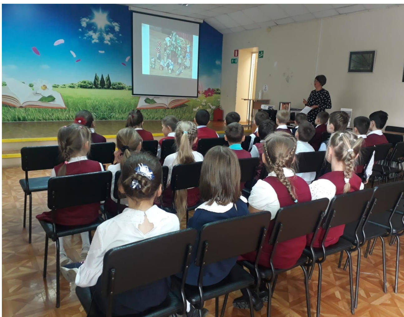
Занятие по изготовлению народной куклы в Библиотеке №31