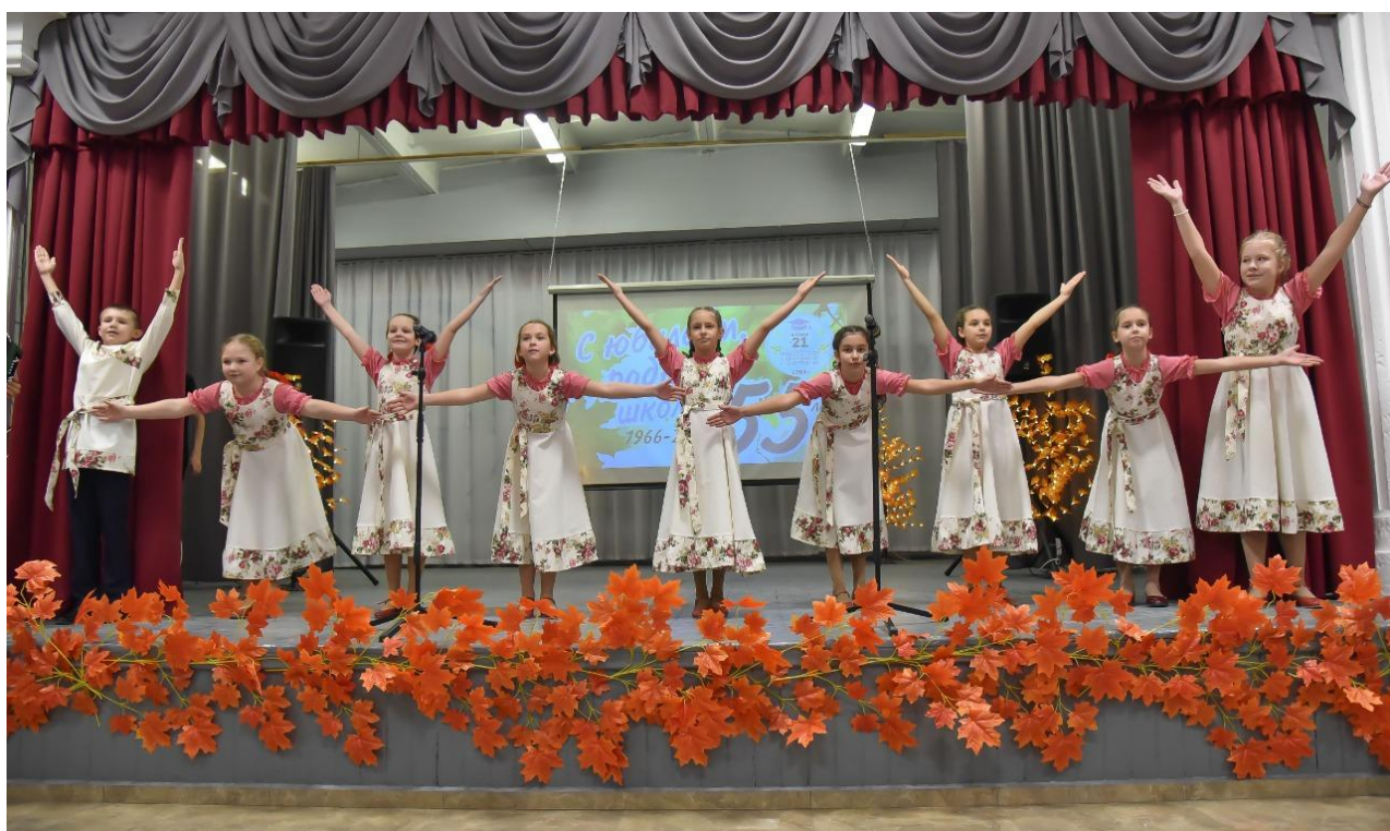
Школьный ансамбль «Сморозинки» (призеры городского конкурса «Народные узоры»)