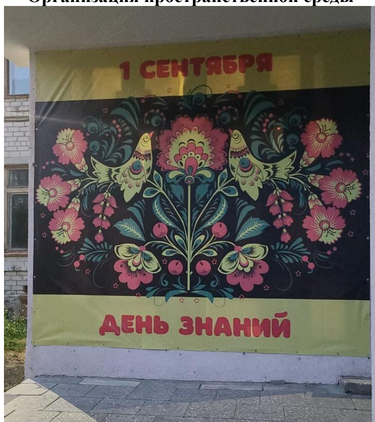
Организация пространственной среды