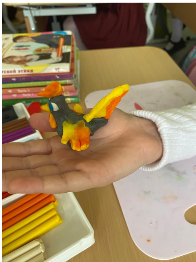
Занятие по изготовлению народной куклы на школьных мастер-классах