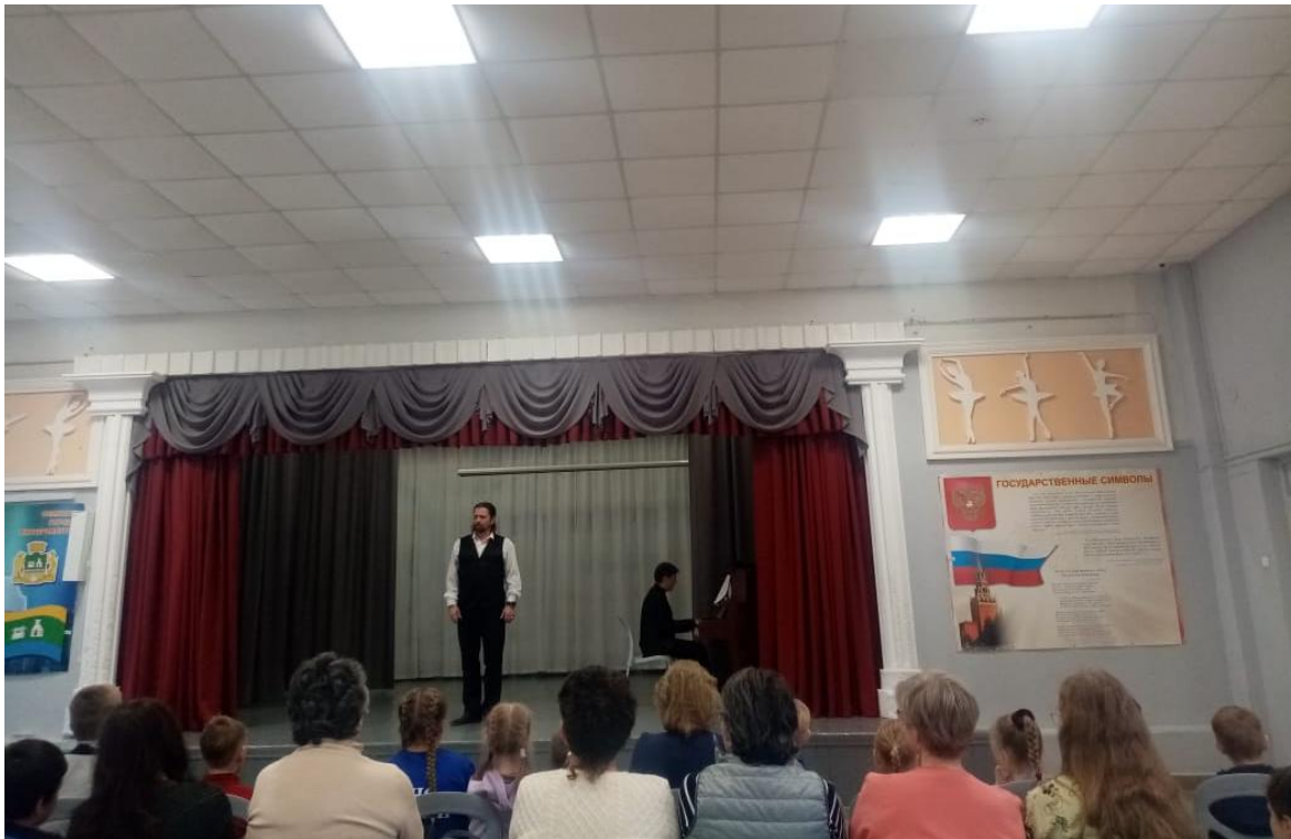
Концерт Свердловской филармонии «О России с любовью»