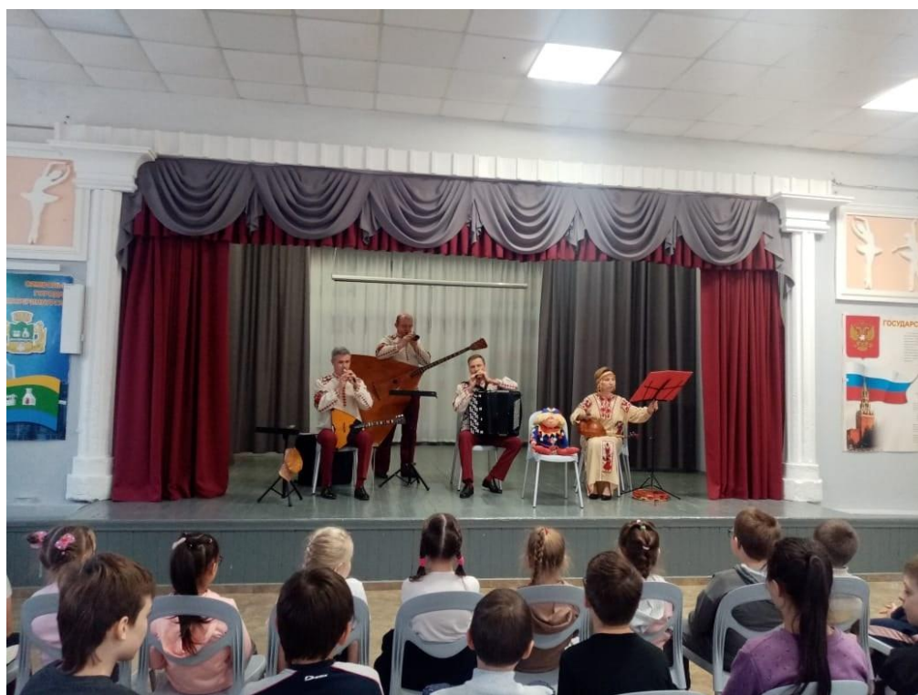
Концерт русской музыкальной группы «Аюшка» с программой «Петрушка в стране музыки»