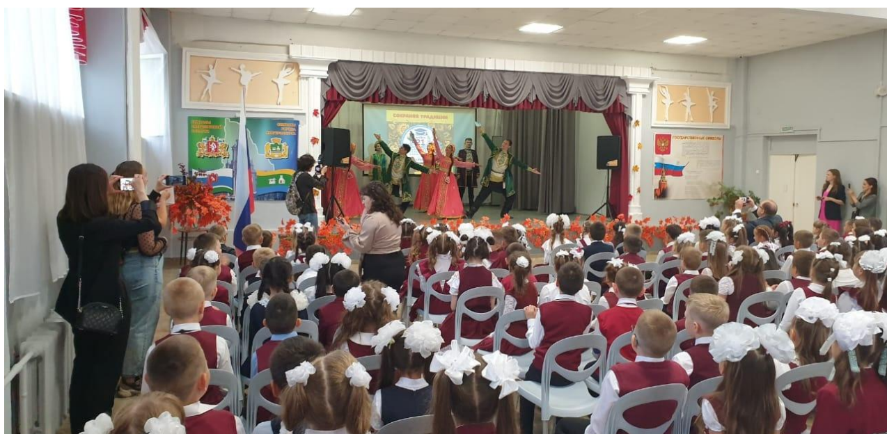
День знаний (выступление Муниципального ансамбля танца и музыки "Иван да Марья")