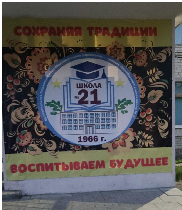
Организация пространственной среды