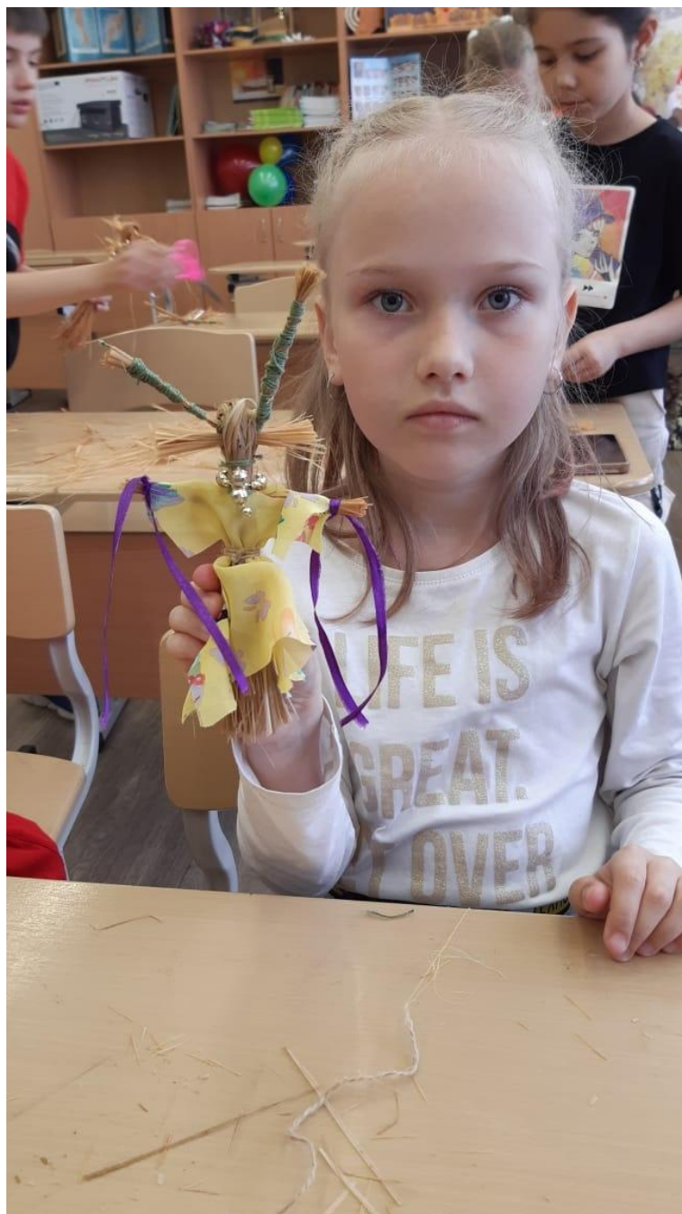
Занятие по изготовлению народной куклы на школьных мастер-классах