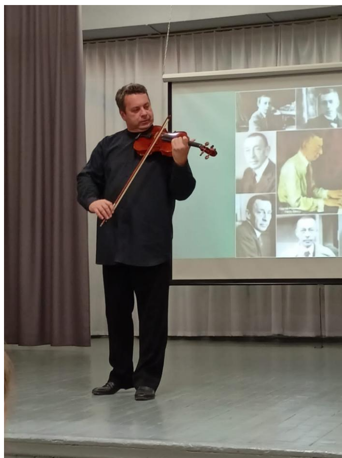
Концерт Свердловской филармонии «К 150-летию С.В. Рахманинова»