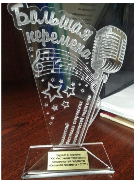
Заслуженная награда педагогического коллектива на конкурсе «Большая перемена -2021»