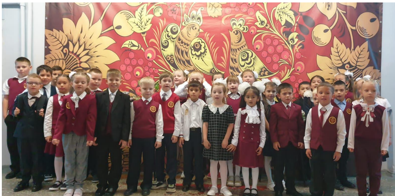
Организация пространственной среды