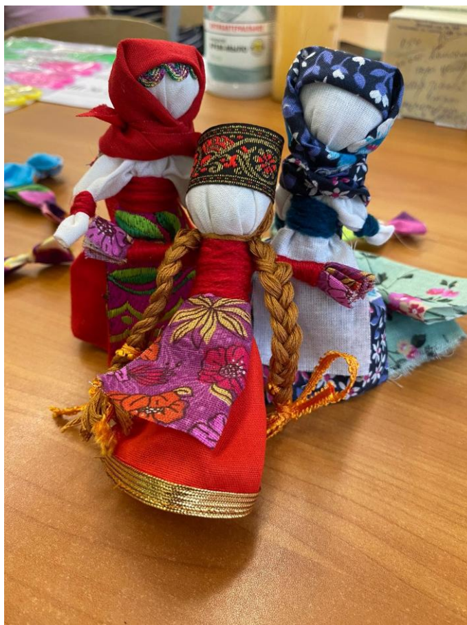
Занятие по изготовлению народной куклы на школьных мастер-классах