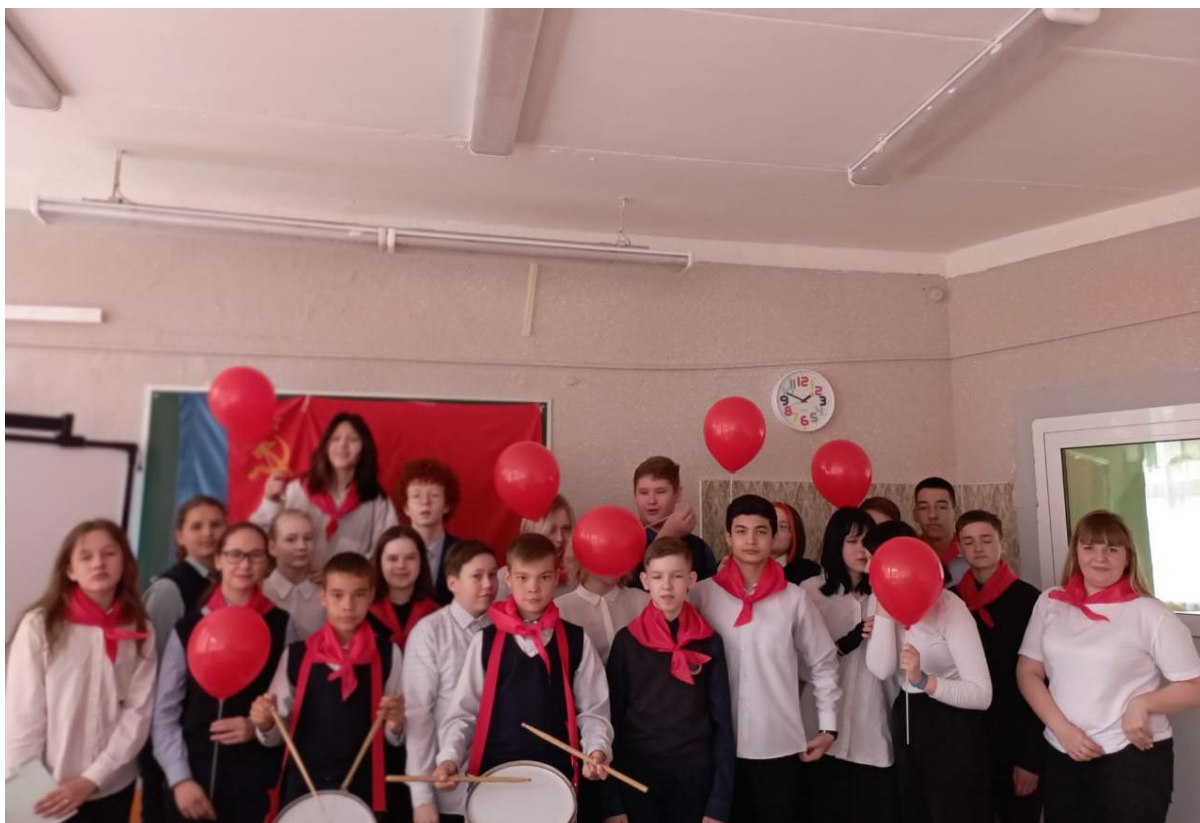
Занятие в рамках договора с МАУ ДО «Детско-юношеский центр «Спутник»