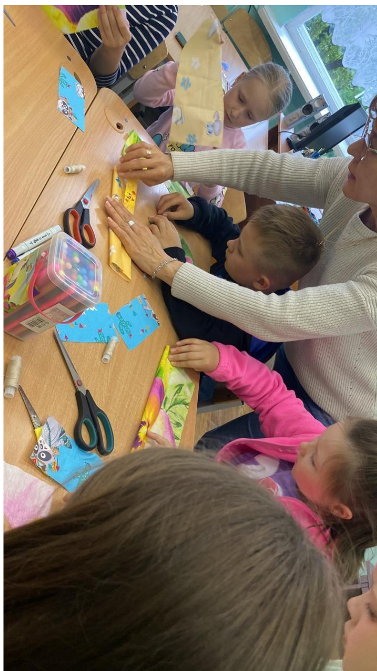
Занятие по изготовлению народной куклы на школьных мастер-классах