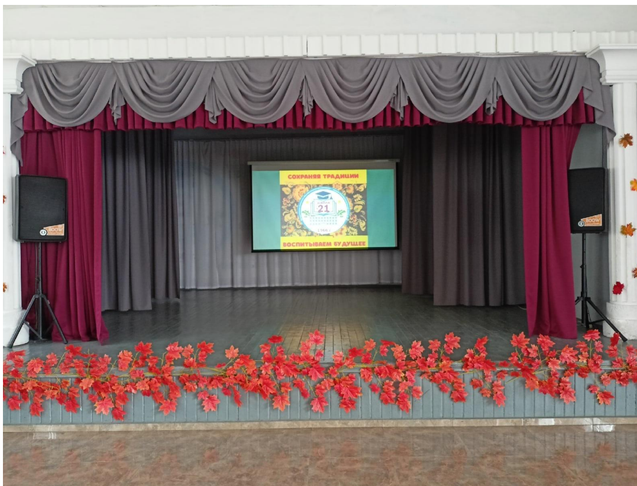
Организация пространственной среды