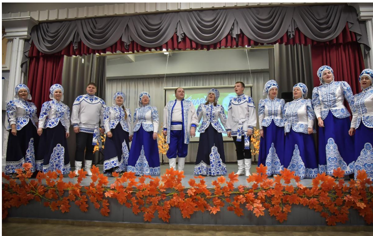
Ансамбль коллектива педагогов