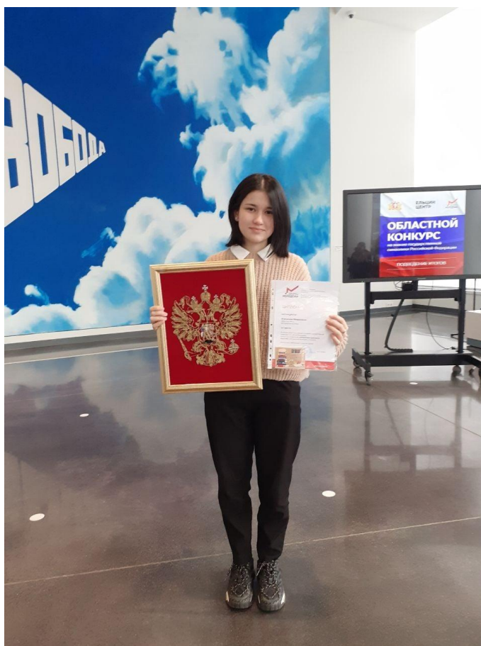
Победа в областном конкурсе на знание Государственной символики РФ