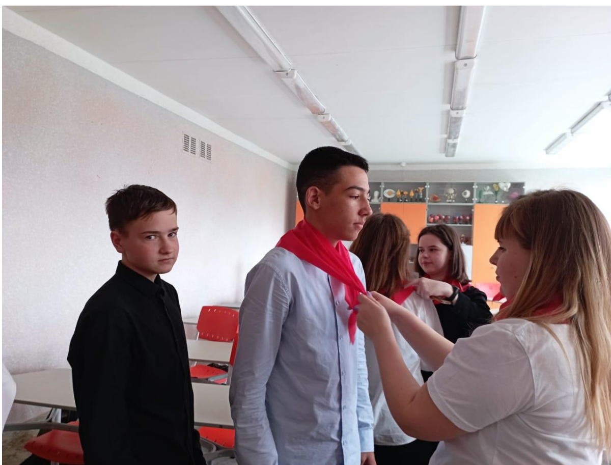
Занятие в рамках договора с МАУ ДО «Детско-юношеский центр «Спутник»