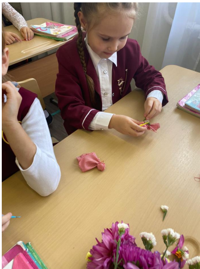
Занятие по изготовлению народной куклы на школьных мастер-классах